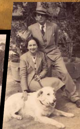
Over century long tradition of cynology in Samobor