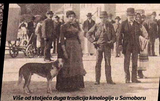
Više od stoljeća duga tradicija kinologije u Samoboru